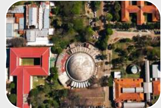
Las 14 Facultades