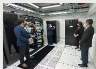
SISTEMA DE AIRE DE PRECISIÓN - CNC LICITACIÓN POR CONCURSO DE OFERTAS ID N° 377.687