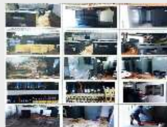
SISTEMA DE ACONDICIONAMIENTO DE AIRE - CENTRO DE CONVENCIONES