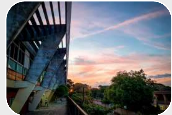
El Colegio Experimental Paraguay - Brasil