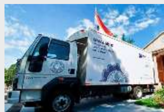
LABORATORIO MÓVIL - CONACYT Acta de Recepción Definitiva ID Nro. 398.203