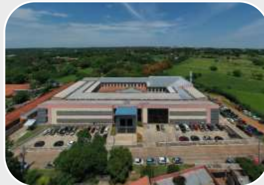
El Instituto de Investigaciones de Ciencias de la Salud